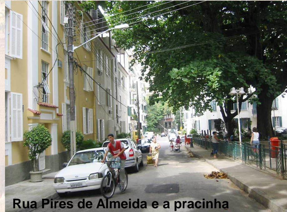
Rua Pires de Almeida e a pracinha

“... No setor da praça, observamos pessoas tranqüilas circulando – em geral mulheres guiando carrinhos de bebês, passeando com seus cães ou saindo para o trabalho. Suas expressões serenas demonstram o quanto o ambiente influencia seu cotidiano: rua arborizada, pouco barulho, boa iluminação e ventilação, microclima agradável e uma sensação de segurança . A Pires de Almeida é uma rua simpática e acolhedora ”