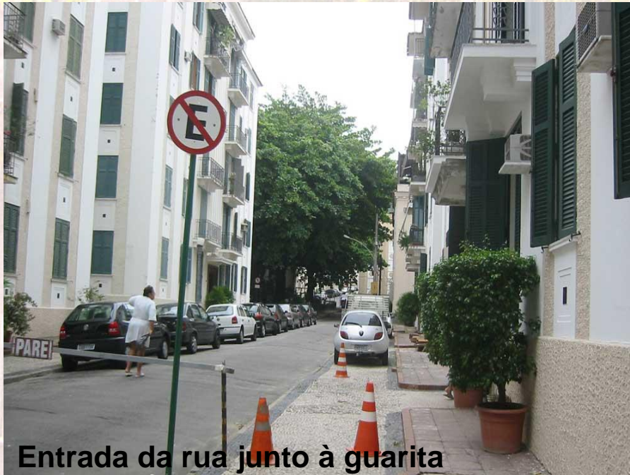
Entrada da rua junto à guarita

“... Desde seu início a rua – sem saída – é tranqüila e agradável , com pessoas entrando ou saindo calmamente , em contraste com a esquina, mais movimentada. Não percebemos correria ou tumulto...”