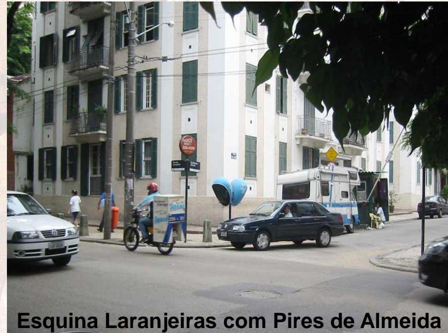
Esquina Laranjeiras com Pires de Almeida