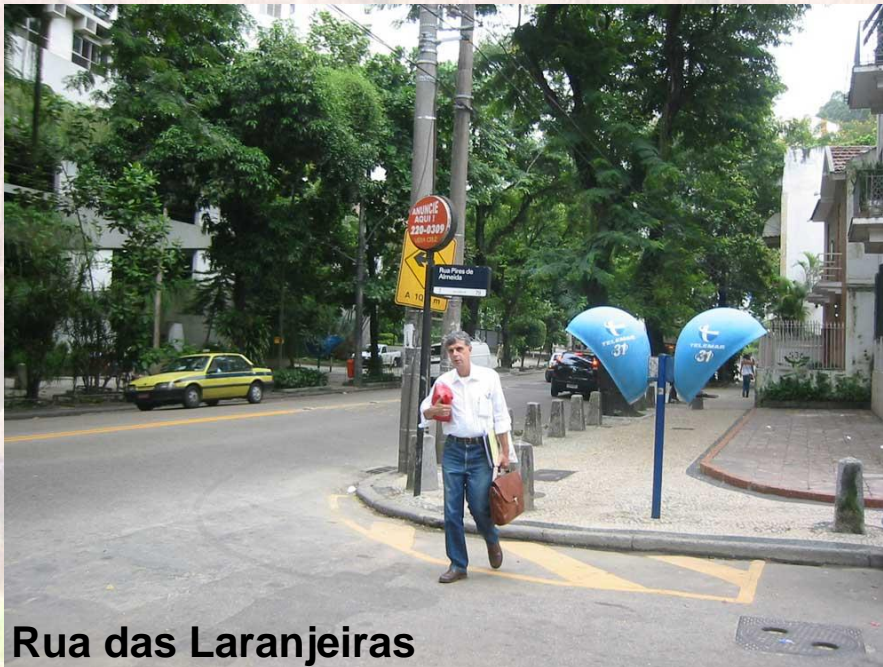
Rua das Laranjeiras