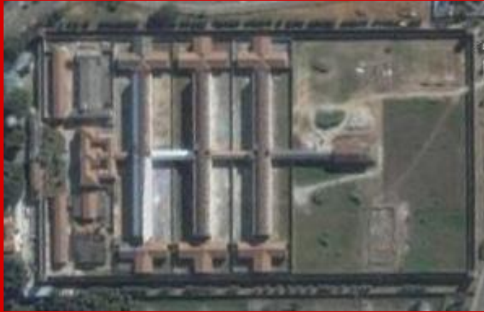
Penitenciária do estado de São Paulo