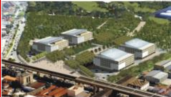
Maquete eletrônica da área institucional - projeto original