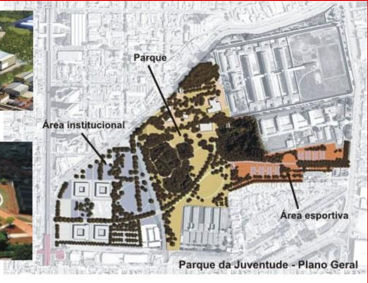
Parque da Juventude - Plano Geral