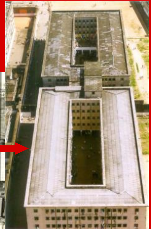
Pavilhão 8 e 9